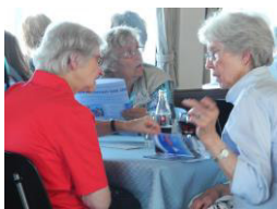
Auf dem Zürichsee